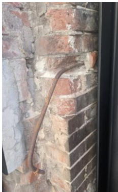
鉄筋が入っている